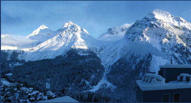
WINTER auch in Arosa